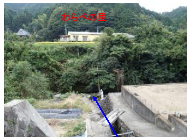
保全対象：わらべの里