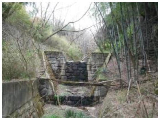
1号えん堤下流溪流保全工