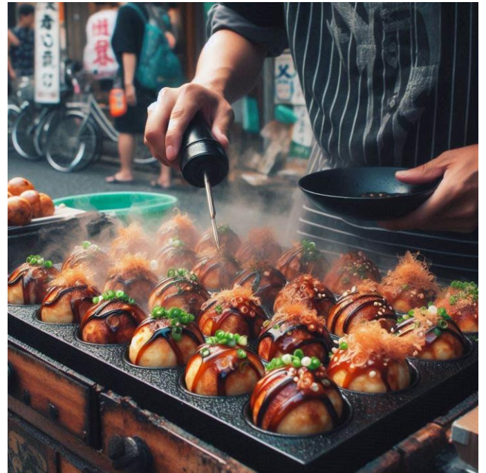
自社製品②(鉄板を使用した調理イメージ)