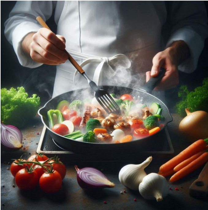
自社製品①(鉄鍋を使用した調理イメージ)