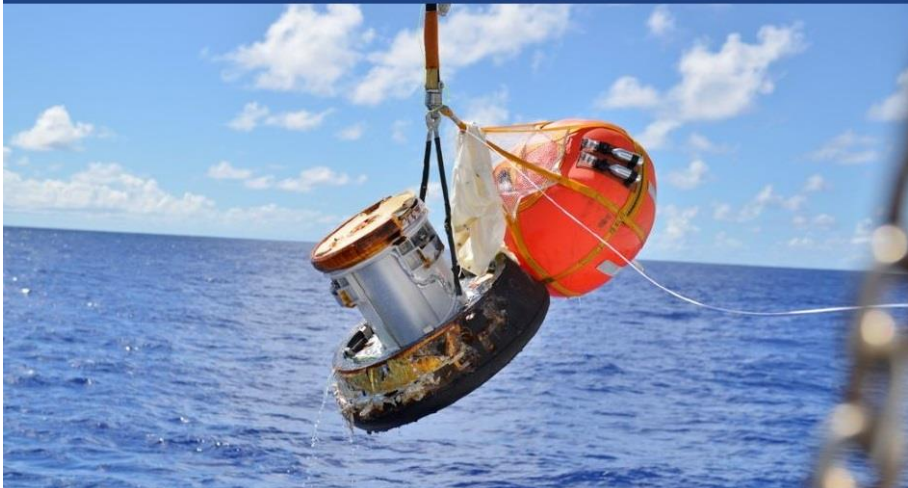
JAXA's re-entry capsule with the double insulated vacuum container