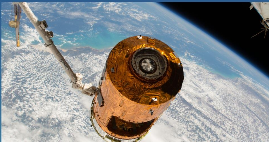
"KOUNOTORI" (HTV7) with JAXA's re-entry capsule