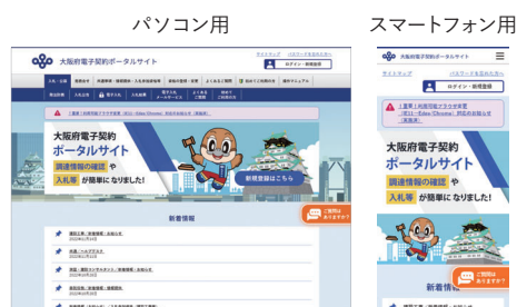
電子契約ポータルサイト画面（イメージ）