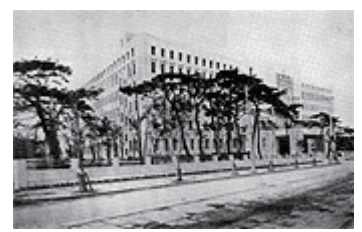
現大阪府庁舎（大正15年竣工時）