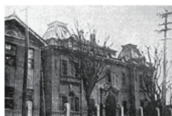
江之子島旧議事堂