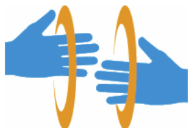
【手話マーク】 所管：一般財団法人全日本ろうあ連盟