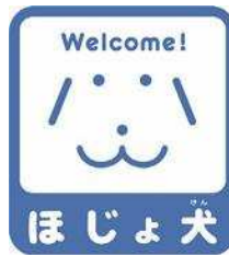
【ほじょ犬マーク】 所管：厚生労働省