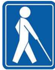
【盲人のための国際シンボルマーク】 所管：社会福祉法人日本盲人福祉委員会