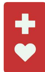
【ヘルプマーク】 所管：東京都