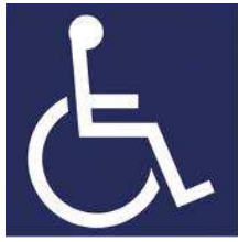
【障害者のための国際シンボルマーク】 所管：公益財団法人日本障害者リハビリテーション協会