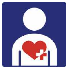
【ハート・プラスマーク】 所管：特定非営利活動法人ハート・プラスの会