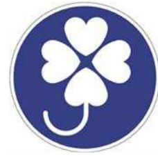
【身体障害者標識 (身体障害者マーク)】 所管：警察庁