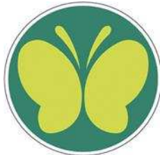
【聴覚障害者標識 (聴覚障害者マーク)】 所管：警察庁