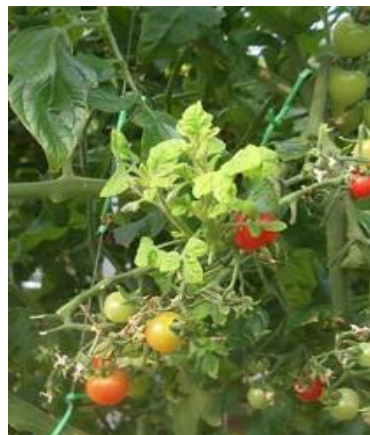
トマト黄化葉巻病発症株