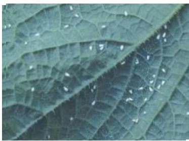
コナジラミ類成虫*