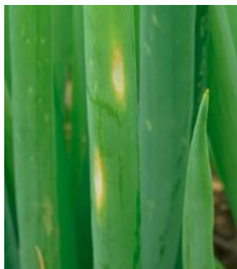
えそ条斑病の葉の病斑