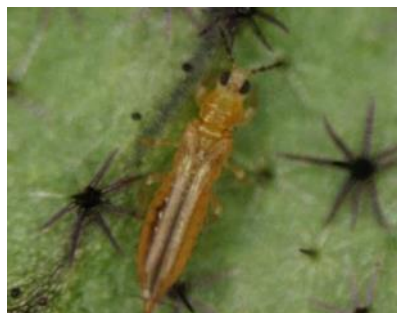
ミナミキイロアザミウマ成虫※