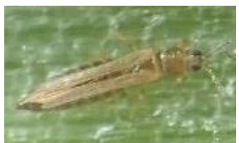
ネギアザミウマ成虫