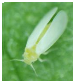
タバココナジラミ※