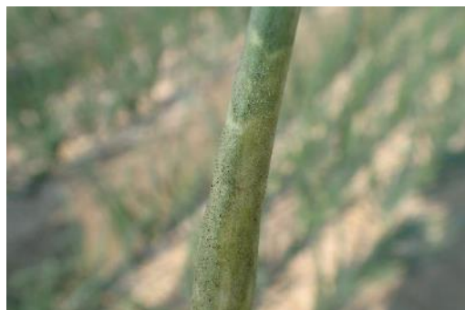
二次感染株の症状