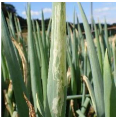
葉の食害痕(新系統)