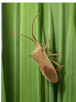
ホソハリカメムシ