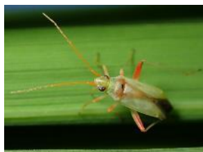
アカスジカスミカメ