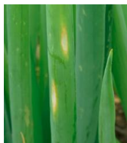
えそ条斑病の葉の病斑