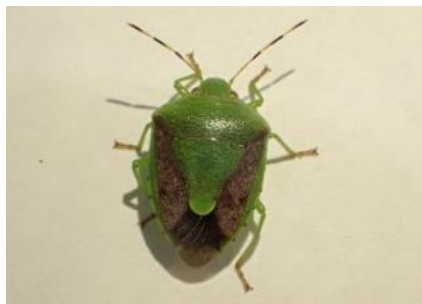
チャバネアオカメムシ