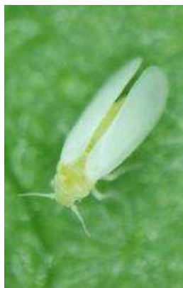
タバココナジラミ※