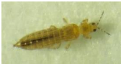
ミカンキイロアザミウマ成虫※