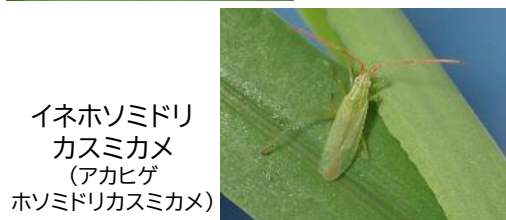
イネホソミドリカスミカメ (アカヒゲホソミドリカスミカメ)