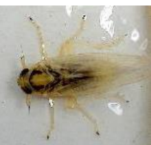
ヒメトビウンカ【成虫】