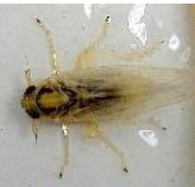
ヒメトビウンカ(成虫)