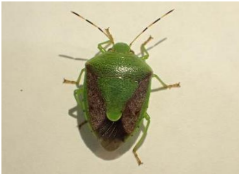
チャバネアオカメムシ