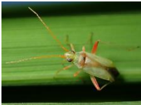
↑アカスジカスミカメ