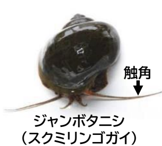
ジャンボタニシ (スクミリングガイ)