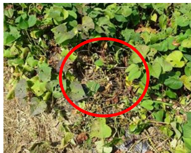
被害株の葉の変色