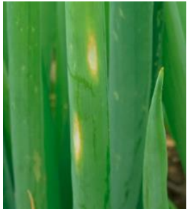
えそ条斑病の葉の病斑