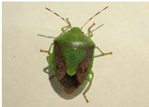
チャバネアオカメムシ