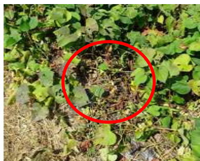
被害株の葉の変色