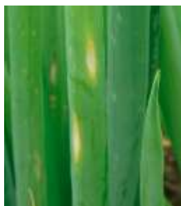
えそ条斑病の葉の病斑