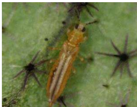
ミナミキイロアザミウマ成虫※