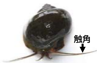
ジャンボタニシ (スクミリンゴガイ)