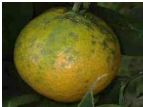
ナシマルカイガラムシの被害