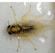
ヒメトビウンカ【成虫】