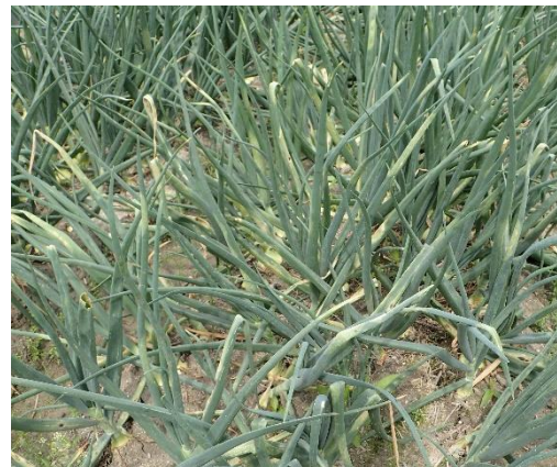
写真1 たまねぎべと病の発病株 （令和6年5月2日撮影）