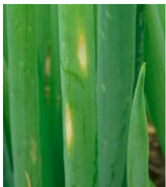
えそ条斑病の葉の病斑