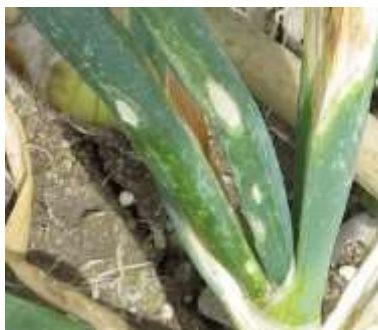
えそ条斑病の症状※