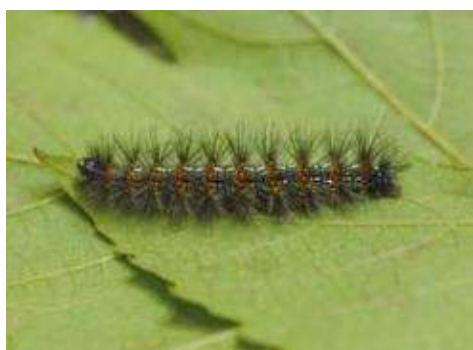
クワゴマダラヒトリの幼虫※