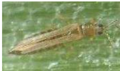
ネギアザミウマの成虫