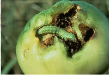
写真2:オオタバコガの幼虫