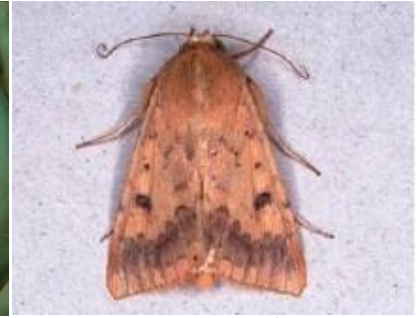
写真3:オオタバコガの成虫