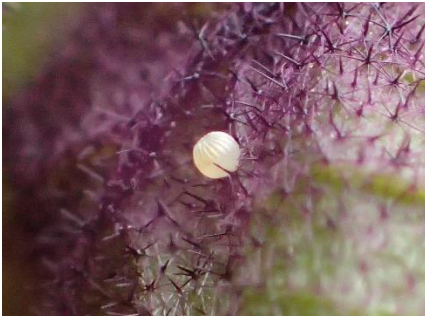
写真1:オオタバコガの卵