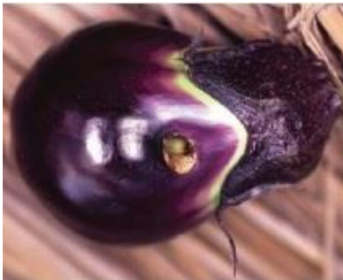
写真4:オオタバコガによる食入痕