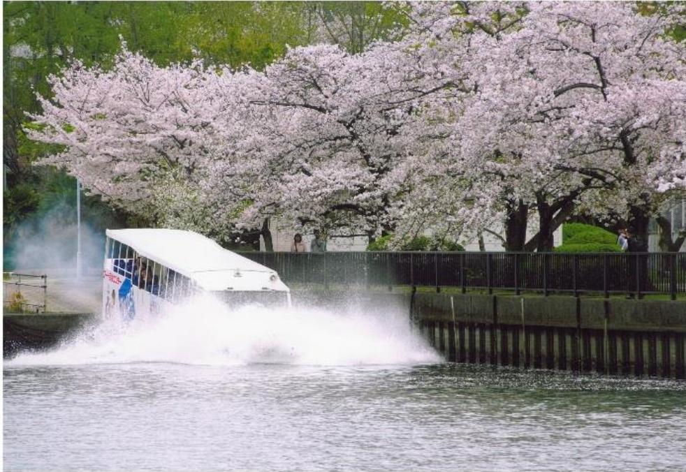
撮影場所：大川