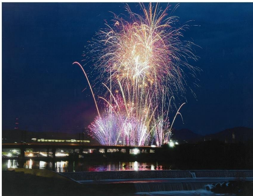
撮影場所：大和川