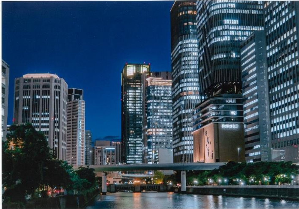
撮影場所：中之島