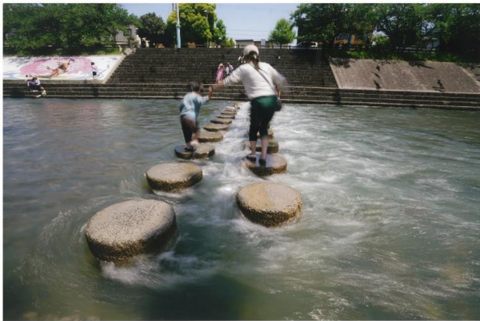
撮影場所：芥川 撮影者：三原 守行 様 様