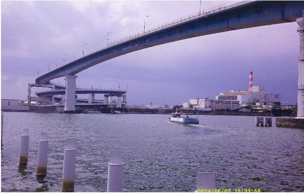
撮影場所：木津川