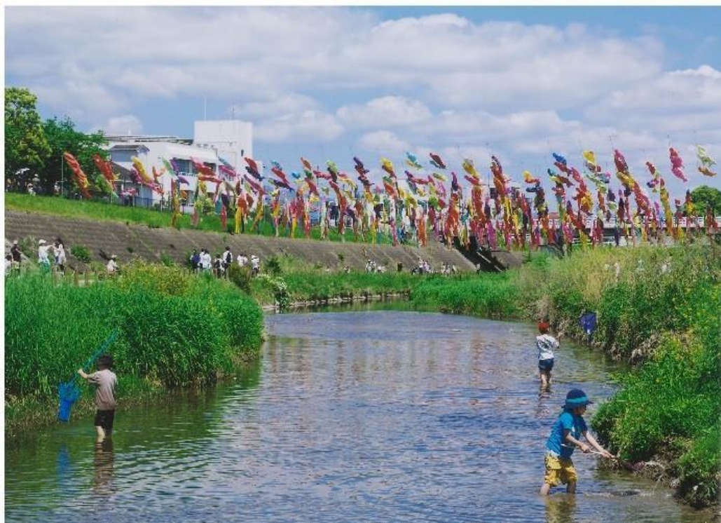
撮影場所：大正川