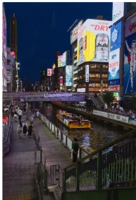
撮影場所：道頓堀川