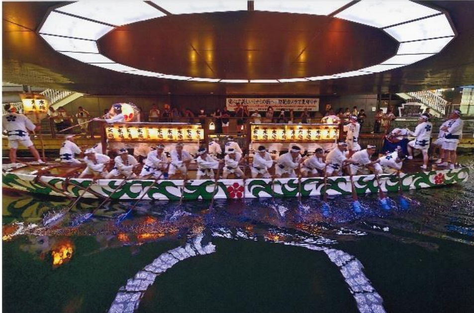
撮影場所：道頓堀川