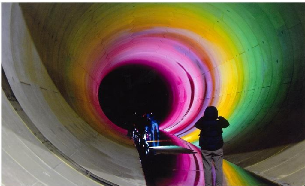
撮影場所：寝屋川南部地下河川（若江立坑）