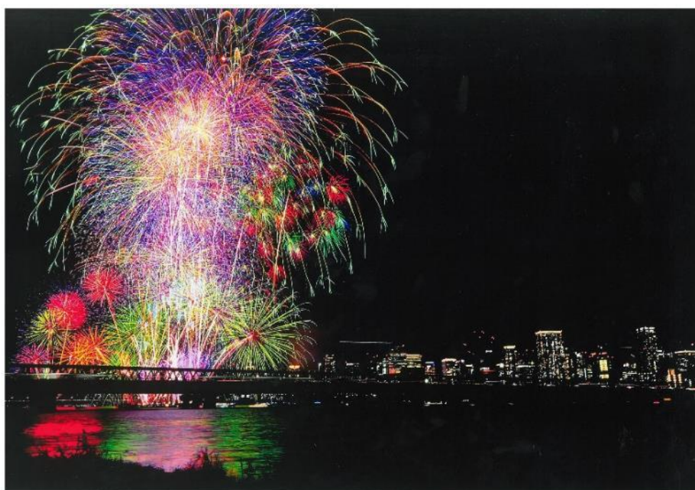
撮影場所：淀川