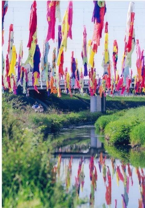
撮影場所：大正川