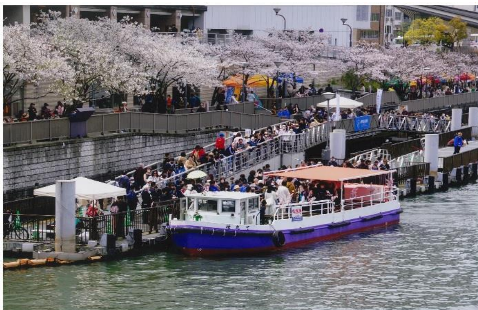
撮影場所：大川