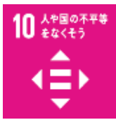
人や国の不平等をなくそう