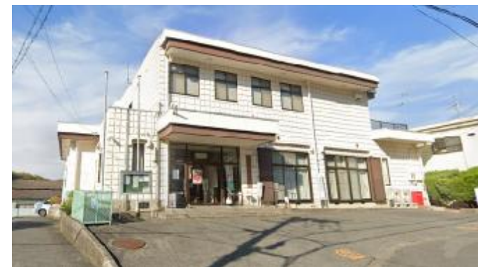
保全対象：旧国道170号・公民館