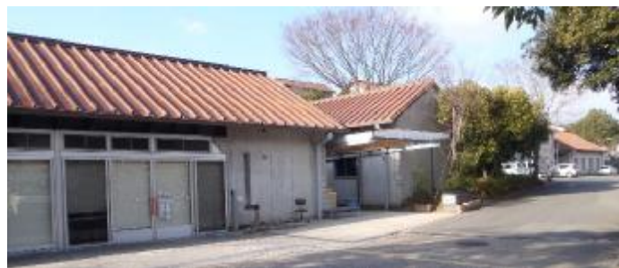
保全対象：要配慮者利用施設