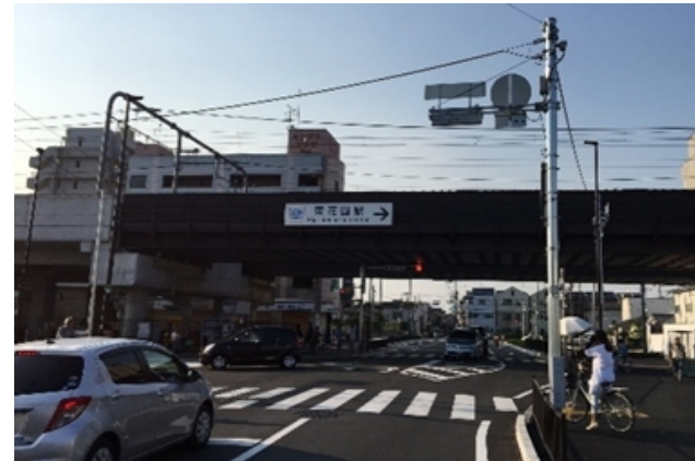
②鉄道高架化後(東花園駅付近)