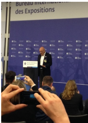
(パリ生まれのロシア人ジャーナリスト)