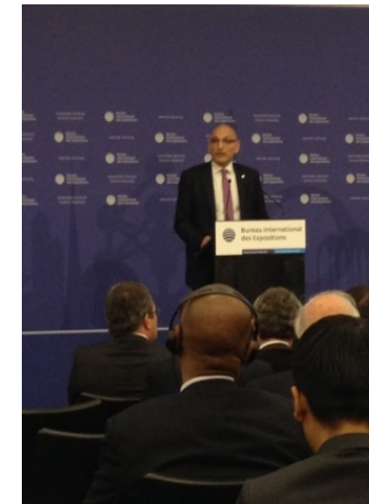
(2025年国際博覧会タスクフォース長)