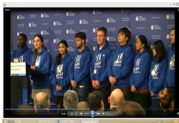
(ヤングアンバサダー)