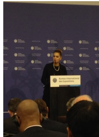
(誘致委員会 国際担当)