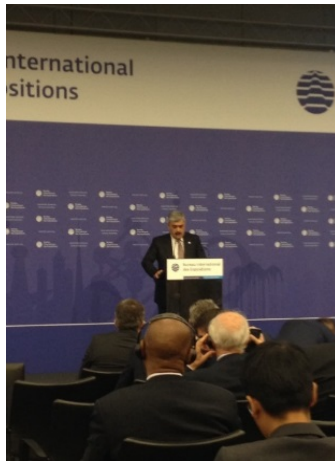
(財務大臣兼誘致委員会会長)