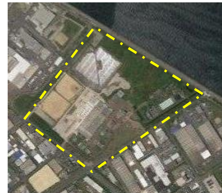
中部水みらいセンター(処理場)