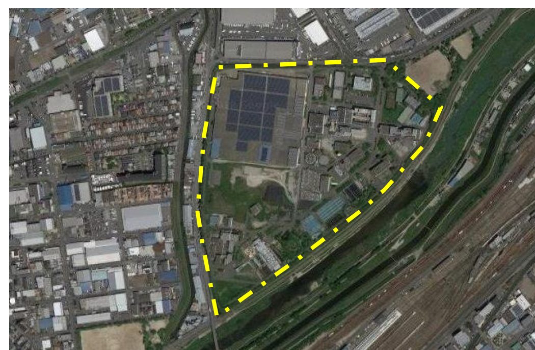
中央水みらいセンター (処理場)