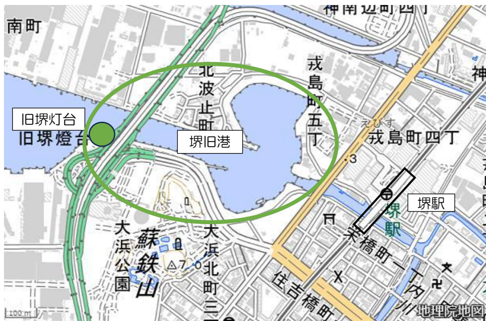
(堺駅との位置関係：地理院地図を元に作成)