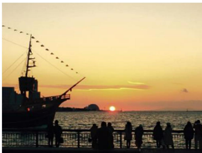
大阪港 中央突堤ダイヤモンドポイント