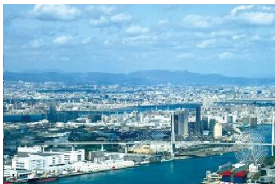
展望台からの景色（昼）