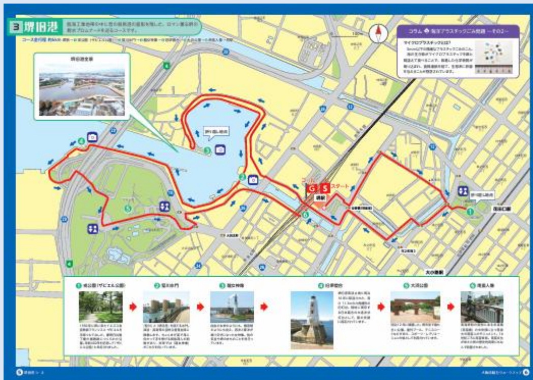
堺旧港コースのウォークマップ

前頁の「旧堺燈台」は、全 10 コースの中の堺旧港コース（コース全行程約 6km）で紹介されています。