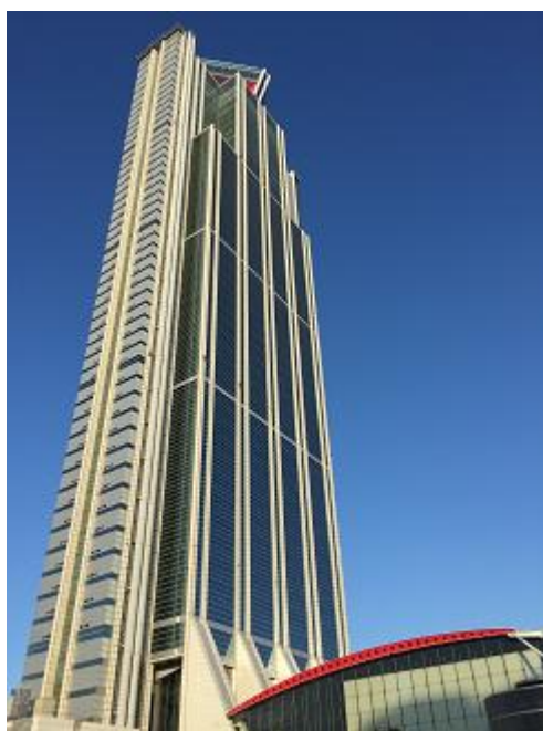
さきしまコスモタワーの外観