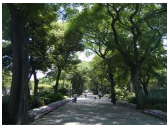
潮掛け道