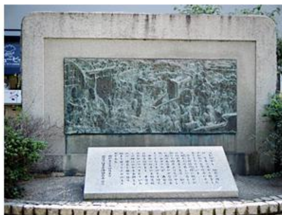
源氏物語碑