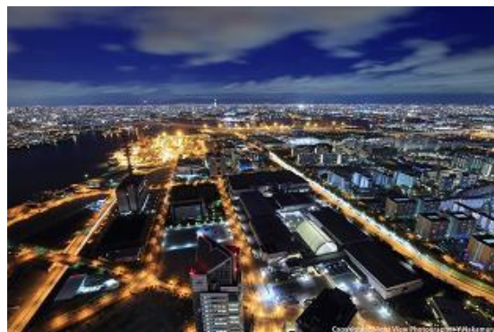
展望台からの景色（夜）