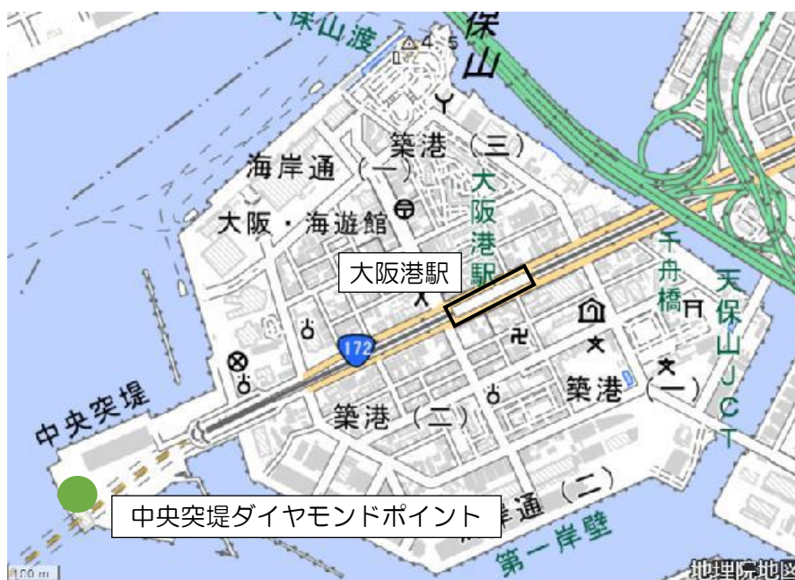
(大阪港駅との位置関係：地理院地図を元に作成)