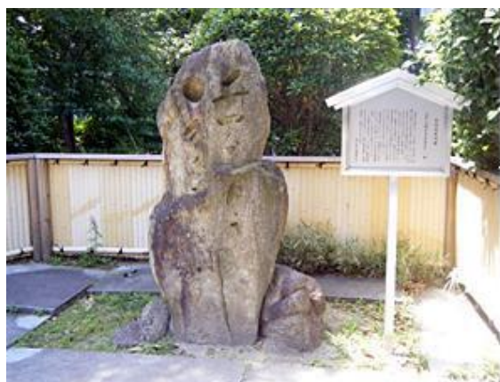
芭蕉句碑