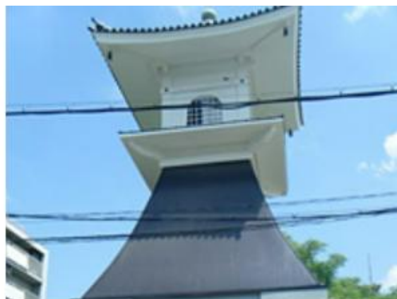
高灯籠（再建）