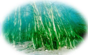
海藻(うみくさ)藻場