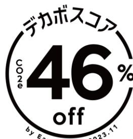
デカポスコア (Earth hacks)