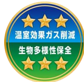
農産物の環境負荷低減に関する評価・表示ラベル（農林水産省）