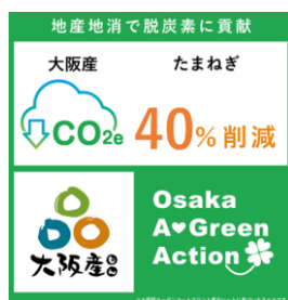
大阪版CFPラベル（大阪府）