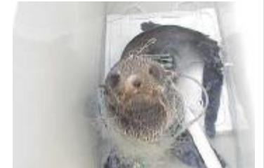
海ごみが絡まったオットセイ

※マイクロプラスチック 5mm以下の微細なプラスチックごみのこと。海の生き物が餌と間違えて食べることで、吸着した化学物質が取り込まれ、生態系に影響を与えることが懸念されている。