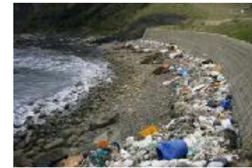
海岸に漂着した海ごみ

大阪湾では、プラスチックごみが漂流ごみ全体の約8割を占め(図1)、大阪湾に漂着したペットボトルのほとんどは国内製(図2)。海洋プラスチックごみの多くが、陸域由来と考えられている。