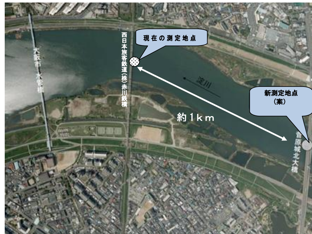
淀川水域の水質測定地点図