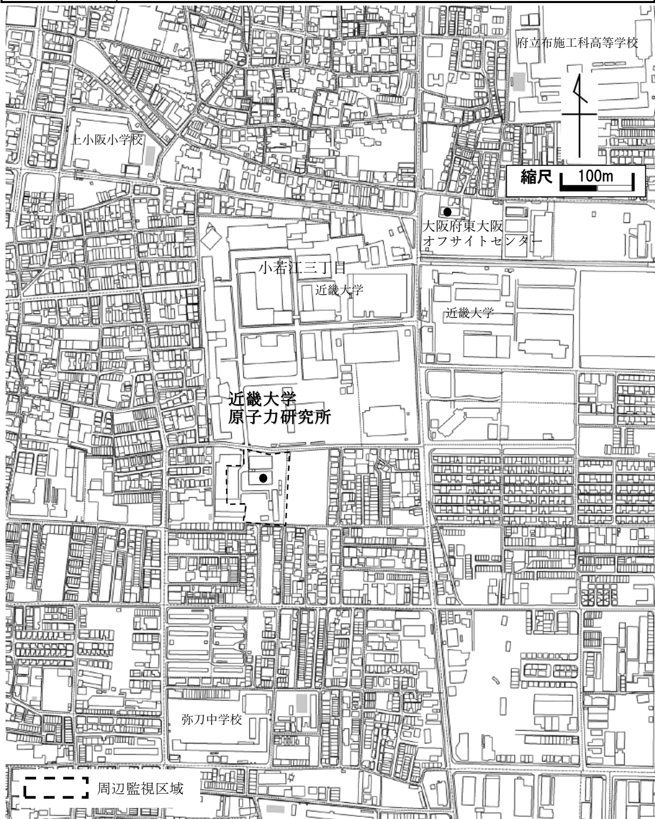
近畿大学原子力研究所