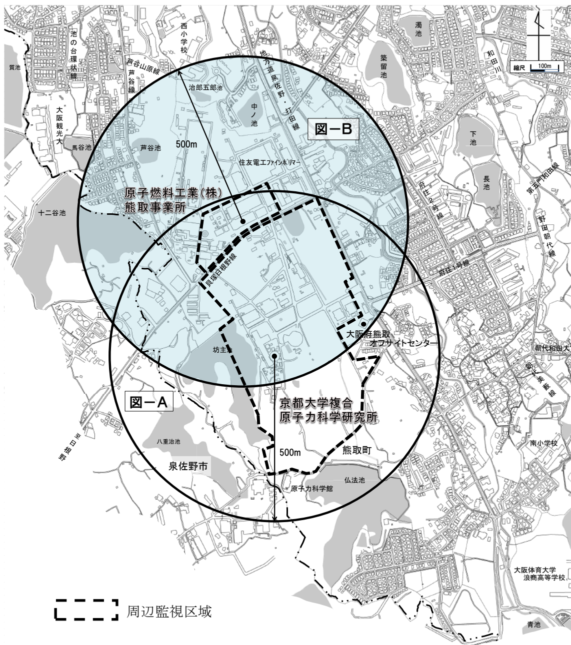
〔図-A〕 京都大学複合原子力科学研究所からおおむね半径500mの範囲 〔図-B〕 原子燃料工業株式会社熊取事業所からおおむね半径500mの範囲