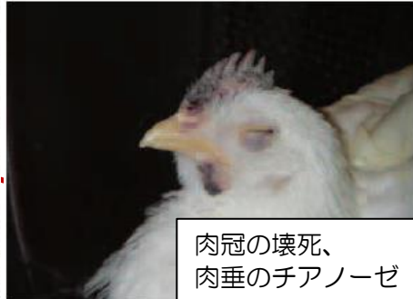
肉冠の壊死、 肉垂のチアノーゼ

これらの特定症状等を発見した場合は、 直ちに家畜保健衛生所へ通報をお願いします！