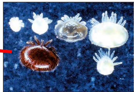
ミツバチヘギイタダニ