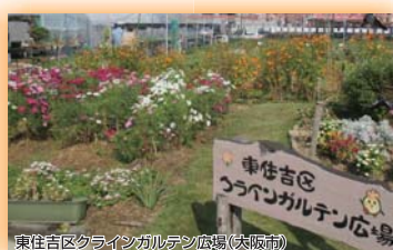
(公財)国際花と緑の博覧会記念協会会長賞