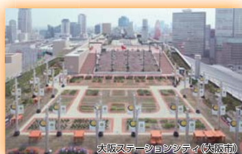
(一社)ランドスケープコンサルタンツ協会 関西支部長賞