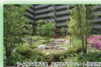
(公財)国際花と緑の博覧会記念協会会長賞