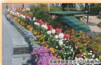
(公財)国際花と緑の博覧会記念協会会長賞