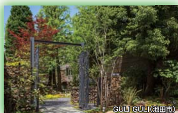
(一社)ランドスケープコンサルタンツ協会 関西支部長賞