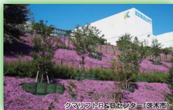
(公財)国際花と緑の博覧会記念協会会長賞