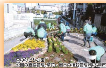
(一社)ランドスケープコンサルタンツ協会 関西支部長賞