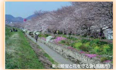
新川姫並と花を守る会(高槻市) 大阪府知事賞