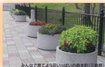
みんなで育てよう花いっぱい島本町(三島町) 大阪府都市緑化フェア実行委員会長賞