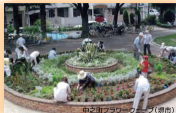
中之町フラワーウェーブ(堺市) (社)ランドスケープコンサルタンツ協会 関西支部長賞