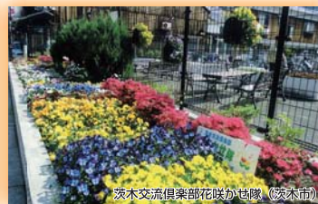
淡木交流倶楽部花咲かせ隊(淡木市) 奨励賞