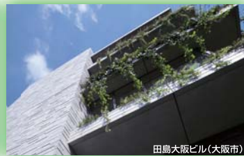
田島大阪ビル(大阪市) (一社)ランドスケープコンサルタンツ協会 関西支部長賞