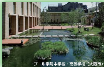
プール学院中学校・高等学校(大阪市) (財)国際花と緑の博覧会記念協会会長賞