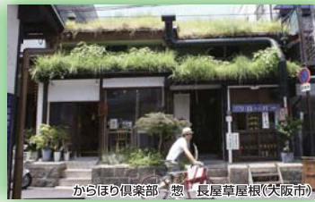
からほり倶楽部-憩-長屋草屋根(大阪市) 特別賞(審査委員長賞)