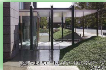
ウエスト上本町ローレルタワーのランドスケープ(大阪市) (社)ランドスケープコンサルタンツ協会 関西支部長賞