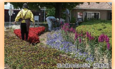
花と鳥の会いがき(交野市) 奨励賞