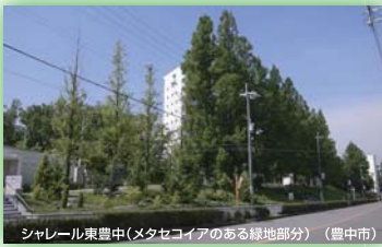
シャレール東豊中(メタセコイアのある緑地部分)(豊中市) 大阪府都市緑化フェア実行委員会長賞