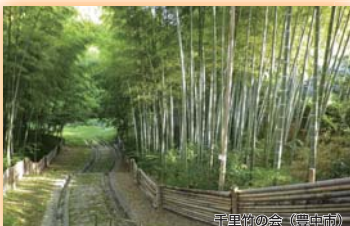
千里竹の会(豊中市) (財)国際花と緑の博覧会記念協会会長賞