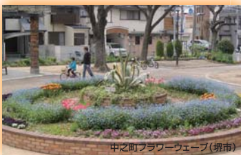
中之町フラワーウェーブ(堺市) 大阪府知事賞