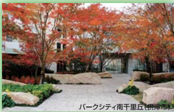
パークシティ南千里丘(堺市) 大阪府知事賞