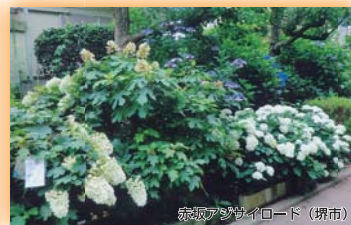
赤坂アジサイロード(堺市) (財)国際花と緑の博覧会記念協会会長賞