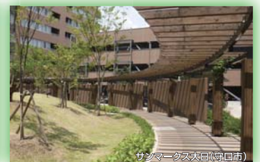
サンマークスタッド(守口市) 大阪府都市緑化フェア実行委員会長賞