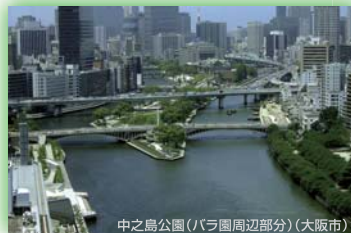
中之島公園(バラ園周辺部分)(大阪市) 大阪府知事賞