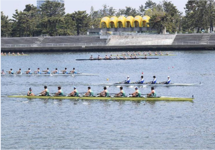
浜寺コースで実施されている大会の様子