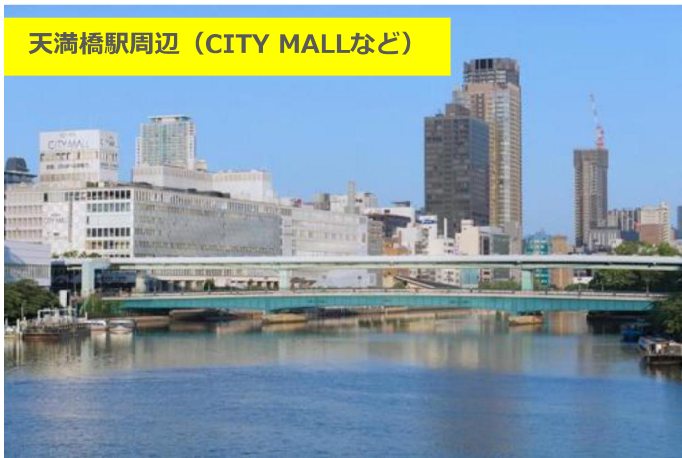
天満橋駅周辺 (CITY MALLなど)