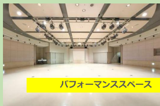
パフォーマンススペース