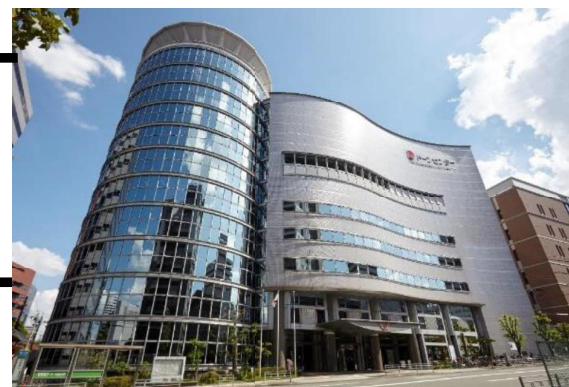
大阪府立男女共同参画・青少年センター (ドーンセンター)