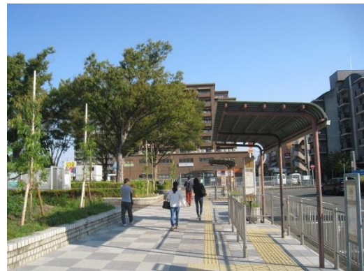
駅前広場等における緑化及び暑熱改善設備等の設置（松原市）