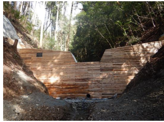
土石流発生を防止する治山ダムの整備（河内長野市岩瀬）