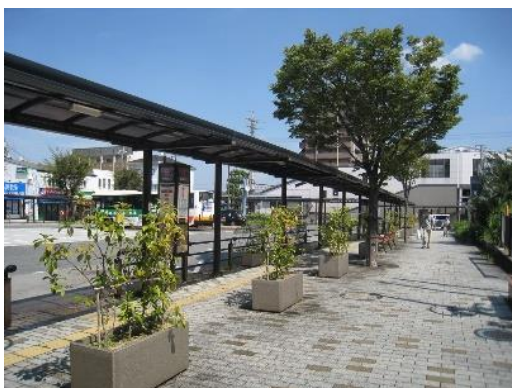
駅前広場等における緑化及び暑熱改善設備等の設置（大阪狭山市）