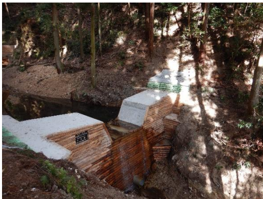
土石流発生を防止する治山ダムの整備（河内長野市加賀田）