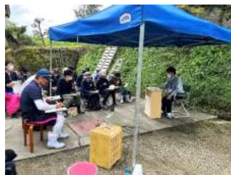
農の普及課による講義の様子▶