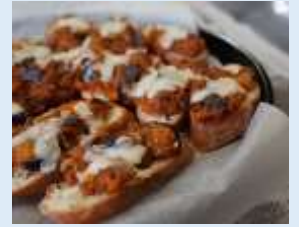
▲最優秀賞「カリっとなすミート」