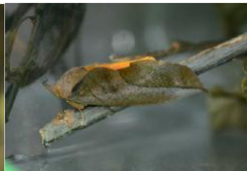
「コノハ」のような翅をもつ成虫