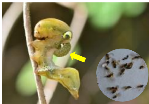
アケビコノハの幼虫

アケビコノハの幼虫の背中ついているつぶつぶは寄生バチです。ハチに寄生されると体液を吸われてしまうので、この幼虫は成虫になることはできません。寄生バチは幼虫にとっては恐ろしい存在ですが、アケビコノハに葉っぱを食べられるアケビにとっては害虫を駆除してくれる存在です。