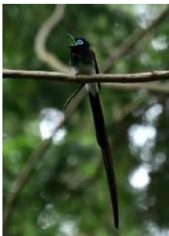
さえずるサコウチョウ

春の森では、あちらこちらで鳥たちのさえずりが響き渡ります。多くの鳥たちが繁殖シーズンに入り、オスは盛んにさえずりメスにアピールします。また、尾を上げる求愛行動も見られます。つがいになるとオスとメスで協力して子育てします。