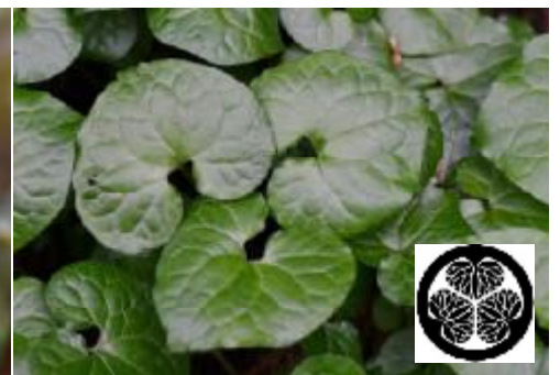
葉と、これをモデルにした家紋