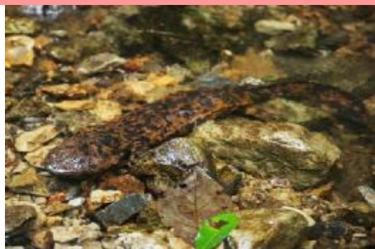
オオサンショウウオの成体

箕面川にはオオサンショウウオが暮らしています。3000万年もの間、ほとんど姿かたちを変えておらず、生きた化石と言われていいます。夜行性で、昼間は川底でじっとしている姿を目にしますが、鋭い歯を使って魚や他の生き物を捉えて食べます。生命力が強くとっても長生きで、100年以上生きることもあるようです。