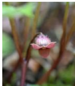
フタバアオイの花

フタバアオイはシカが好んで食べるようで、シカの密度増加によって減っています。国定公園ではシカに食べられないようにネットで囲い、植生を保護する取り組みをしており、設置したネットの中ではフタバアオイが地面を覆っています。