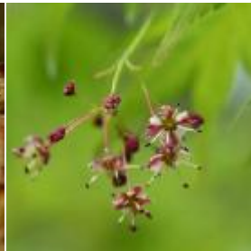
イロハモミジの花