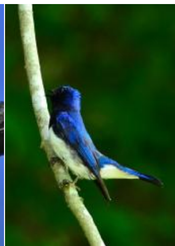
求愛行動をとるオオルリ