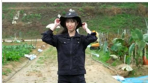
コンテンツ①ファッションショー 実家が専業農家で、来年からOLとして働くけど、休日はお手伝いしたい時のコーデ

#大阪府 #農空間pf #おおさか農空間づくりプラットフォーム #近畿大学 #松本ゼミ #ファッションショー #農業 #農作業着 #農業プロジェクト #農女ライター #農家 #いづみふれあい農の里 #youtube #チャンネル登録 #チャンネル登録お願いします