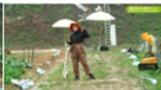
コンテンツ①ファッションショー 仕事を辞めて、自分らしき空間の農業女子になりたい時のコーデ