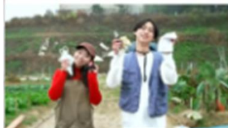
コンテンツ③ファッションショー 新卒して農業を始めたい、パートの場でいつでも帰りたい時のコーデ