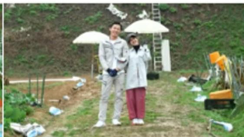
コンテンツ①ファッションショー 共働きだけど、趣味の一つとして週末だけ家庭菜園をしたい時のコーデ