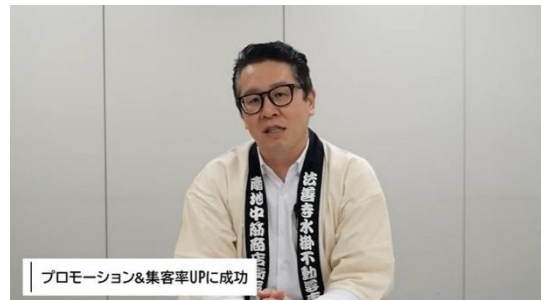
プロモーション&集客率UPIに成功