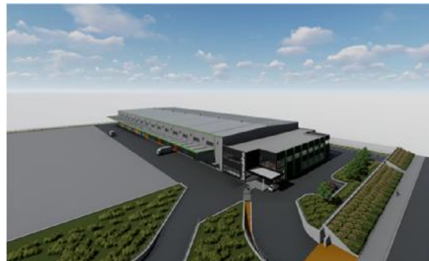
(新工場完成イメージ)