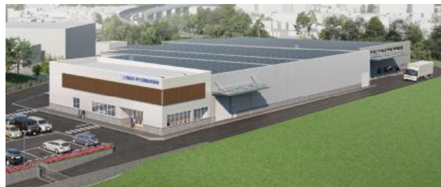
(新工場完成イメージ)