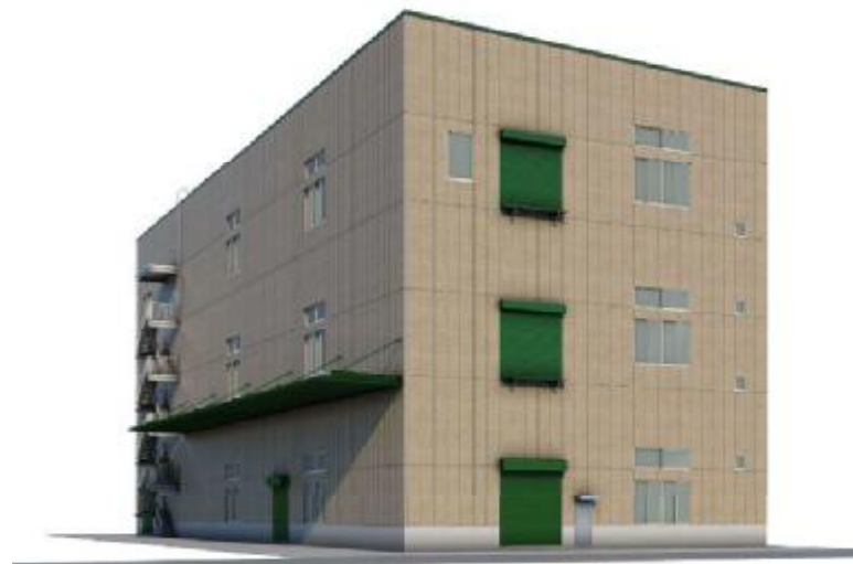
(新工場完成イメージ)

施設名称：サカ工新工場 立地場所：東大阪市新喜多1丁目83番2,83番6 敷地面積：1,510.14㎡ 建築面積：1,026.32㎡ 延べ面積：1,345.68㎡ 着工：令和3年4月10日 操業予定：令和4年5月1日