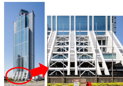
斜め架構の制震ダンパー（外観）