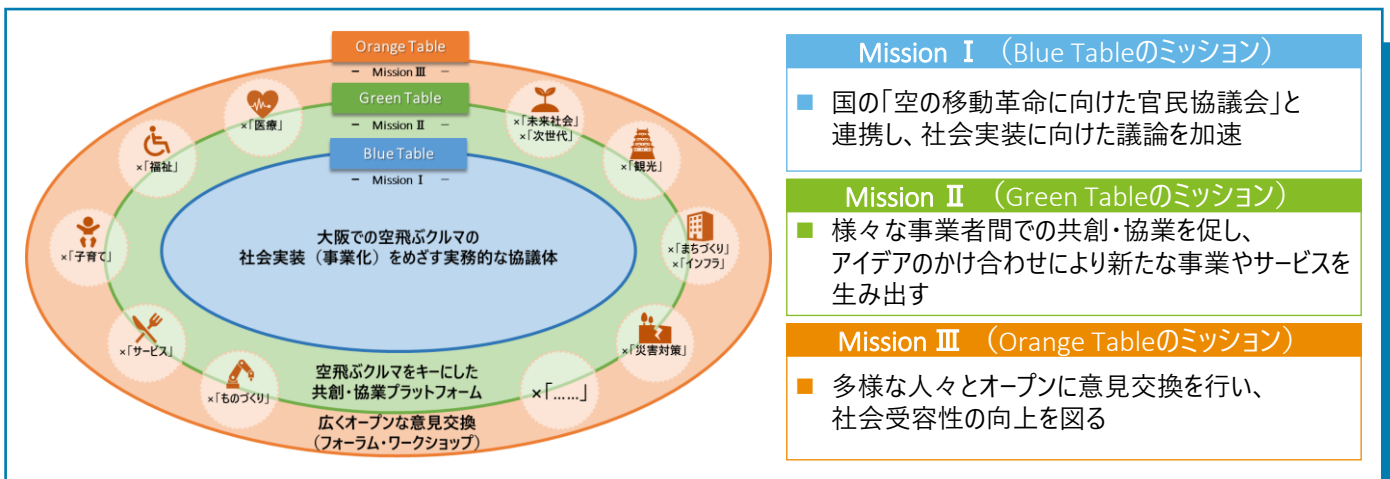
空の移動革命社会実装大阪ラウンドテーブルの概要

空飛ぶクルマの具体的な課題や提案を産官学が協力・連携して整理し、開発に向けた議論や取組みの効率を高めることを目的に、2020年11月、「空の移動革命社会実装大阪ラウンドテーブル」を設立しました。