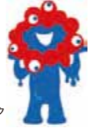
大阪・関西万博公式キャラクター ミャクミャク

2025年の4月13日 から10月13日まで開 催される、大阪・関西万博までいよいよ2年 を切りました。会場では、ミャクミャクフォ トパネルでの記念撮影や、VRゴーグルで仮 想空間・バーチャル大阪を体験できます!