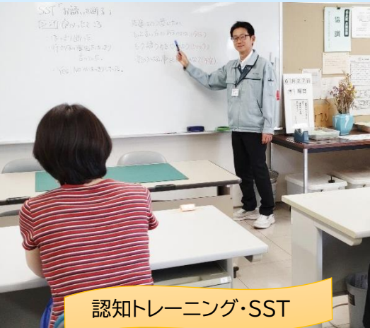
認知トレーニング・SST