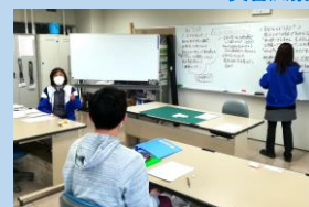
SST(社会生活技能訓練)の様子