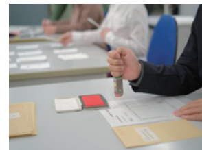
▲事務補助作業(押印作業)