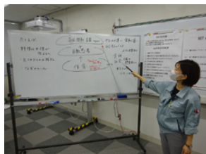
▲SST(ソーシャルスキルトレーニング)