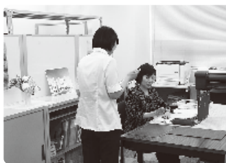
【ビジネスマナー実習】