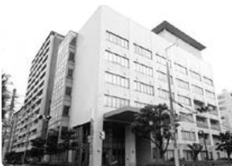
【夕陽丘高等職業技術専門学校】